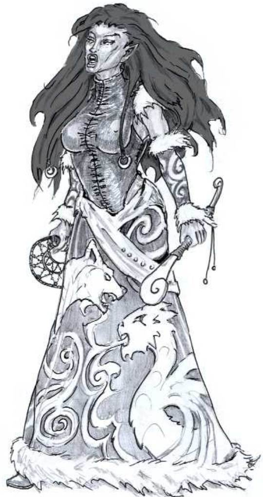
Zeichnung: René Littek; Ban'shi der Salamandersteine

Der Kampagne "In Simyalas Schatten" mag im Reich der Sieben Winde eine gänzlich andere Bedeutung zukommen, wenn die Helden der Menschen sich anschicken, die letzten vielleicht noch überdauernden Elfen Aventuriens aufzuspüren und darauf hoffen, in einer der versunkenen Metropolen oder den menschenfeindlichen Salamandersteinen fündig zu werden. Ebenso mag das Abenteuer "Schwingen aus Eis" die Helden in