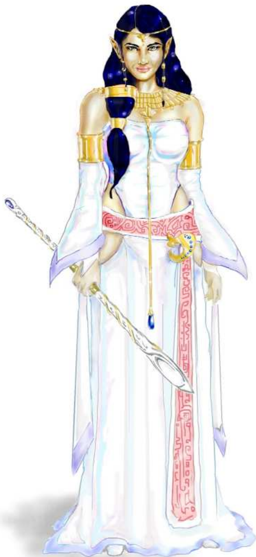
Zeichnung: René Littek; Amariel, Flusslande

Im Elfensturm: Jast organisiert mehrere Raubzüge in die bedrängten Ländereien Albernias, wo er unter der Bevölkerung größeres Elend anrichtet als die Elfen. Für eine Zeit kann er gar die Herrschaft über Jelenvina an sich reißen, nachdem die Elfen die Magier dort besiegten. Niemand ahnt jedoch, dass in den Flusslanden ein Geheimnis verborgen ist, das für den Elfenkönig